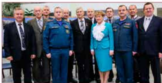
Совет ветеранов Департамента ГОЧСиПБ и ГУ МЧС России по г. Москве на встрече с сотрудниками