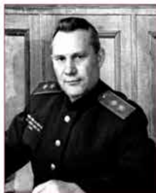
Начальник МПВО страны в 1942 г. М.Ф. Королев