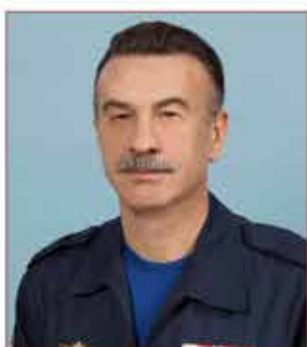
Эдуард Иванович Бондаренко

С 2005 по 2013 г. – начальник Управления гражданской защиты Москвы. Действительный государственный советник города Москвы 1-го класса. Награжден медалями «За отличие в военной службе» I-й и II-й степени, ордена «За заслуги перед Отечеством» II-й степени, знаком отличия «За безупречную службу городу Москве» и другими наградами.