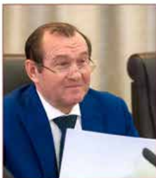
Заместитель Мэра Москвы в Правительстве Москвы П.П. Бирюков, Председатель КЧСиПБ

В настоящее время координационным органом МГСЧС является Комиссия Правительства Москвы по предупреждению и ликвидации чрезвычайных ситуаций и обеспечению пожарной безопасности (КЧС и ПБ). Председателем ее является П.П. Бирюков – заместитель мэра Москвы.