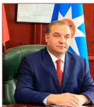
Министр МЧС России В.А. Пучков

В последующем, в рамках формирования федеральных органов исполнительной власти, данный комитет был преобразован в Министерство Российской Федерации по делам гражданской обороны, чрезвычайным ситуа-