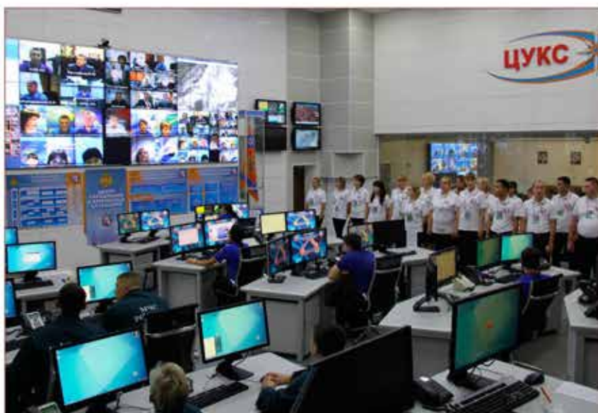
Заступление на дежурство сил и средств ДДС Москвы (ЦУКС)

На ЕСОДУ Москвы возложены: прием сообщений, поступающих от населения и организаций города; первичная обработка сообщений и доведение их до ДДС; сбор информации о состоянии потенциально опасных объектов; оповещение о возникновении ЧС и информирование городского руководства, руководителей органов исполнительной власти и организаций, привлекаемых для реагирования на чрезвычайные ситуации.