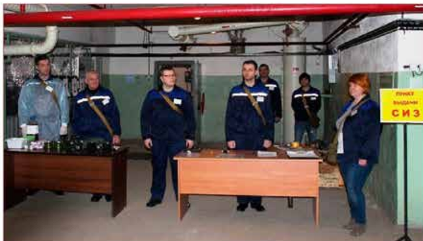
Учебная тренировка сотрудников предприятия

За безупречную работу и большой вклад в дело развития предприятия и совершенствования системы гражданской обороны города Москвы более 260 работников предприятия отмечены ведомственными наградами.