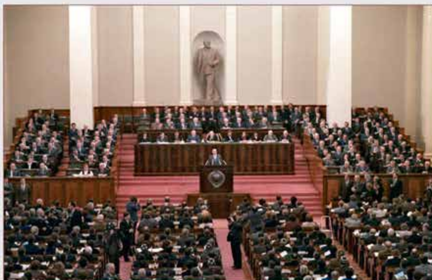
Заседание Верховного Совета СССР

К концу 80-х годов XX века объективно созрела необходимость создания единой общегосударственной системы реагирования на чрезвычайные ситуации природного и техногенного характера. Одним из первых шагов стало принятие в 1989 г. Верховным Советом СССР решения о создании постоянно действующей Государственной комиссии Совета Министров СССР по чрезвычайным ситуациям. Позже, 15 декабря 1990 г., постановлением Совета Министров СССР была образована Государственная общесоюзная система по предупреждению и действиям в чрезвычайных ситуациях, которая включала в себя союзную, республиканские и отраслевые подсистемы. Указанная комиссия и система существовали до распада СССР.