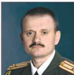
Евгений Николаевич Чернышев

(31.08.1963–20.03.2010гг.), Герой РФ, Дата указа – 24.03.2010 г.