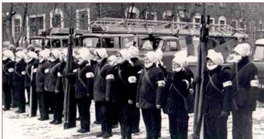
Тренировка медицинских формирований ГО

В короткие сроки был создан запас медицинских средств защиты, большое количество специальных медицинских формирований на местах (отрядов первой медицинской помощи, санитарных дружин и др.).