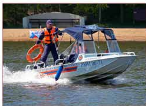
Дежурная смена ПСС «Серебряный Бор» спешит на помощь