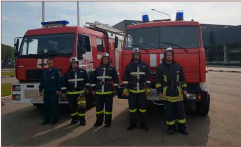
Добровольцы всегда готовы прийти на помощь

единениям пожарной охраны, осуществляющим свою деятельность в виде добровольной пожарной команды, так как имеет на вооружении мобильные средства пожаротушения.