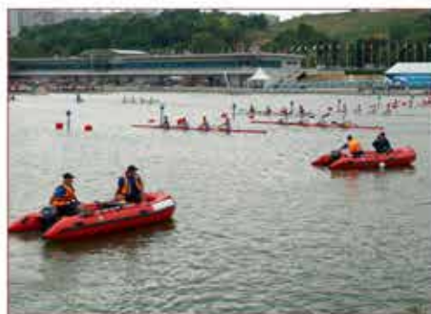
Обеспечение безопасности спортивных соревнований на Гребном канале в Крылатском