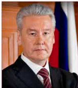
Мэр Москвы С.С. Собянин

В рамках повышения эффективности работы различных элементов системы предупреждения и реагирования на чрезвычайные ситуации в последние годы в г. Москве были приняты: Постановление Правительства Москвы от 18.03.2008 г. № 182-ПП «Об утверждении Положения об организации и ведении ГО Москвы» и Постановление Правительства Москвы «О координации действий органов государственной власти и организаций на территории города Москвы по предупреждению и ликвидации ЧС».