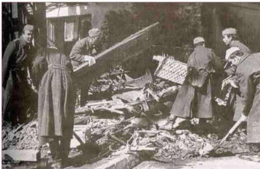
Разбор завалов после бомбежки бойцами МПВО

мобилизация десятков тысяч на строительство оборонительных укреплений и, наконец, непосредственная близость фронта – все это до предела осложнило деятельность МПВО. Значительная часть личного состава формирований МПВО вместе с населением столицы строила оборонительные укрепления под Москвой, сооружала доты, блиндажи, противотанковые препятствия в городе, превращая его в неприступную крепость. За месяц, с 21 октября по 20 ноября 1941 года, в самый напряженный период битвы за Москву, вражеская авиация произвела на нашу столицу 54 налета, в которых участвовало 2000 самолетов, сбросивших на Москву 657 фугасных и 19 тыс. зажигательных бомб. В этот критический для Москвы период бойцы подразделений МПВО помимо своей основной деятельности по ликвидации последствий воздушных налетов немецко-фашистской авиации, привлекалась и к работе на оставшихся в городе предприятиях, которые производили оружие и боеприпасы.