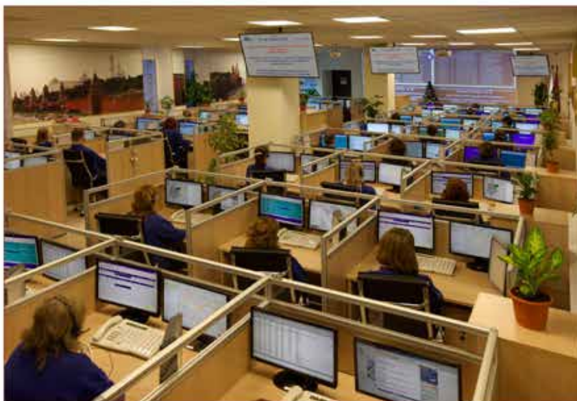
Круглосуточное дежурство операторов ГКУ «Система 112»