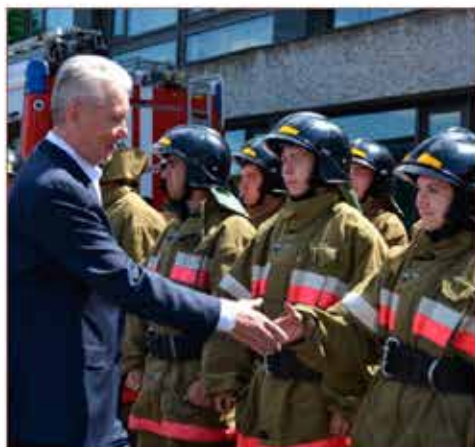
Встреча С.С. Собянина с юными пожарными

Законодательством города Москвы определено, что руководитель гражданской обороны города Москвы – Мэр Москвы. Он осуществляет руководство гражданской обороной в горо-