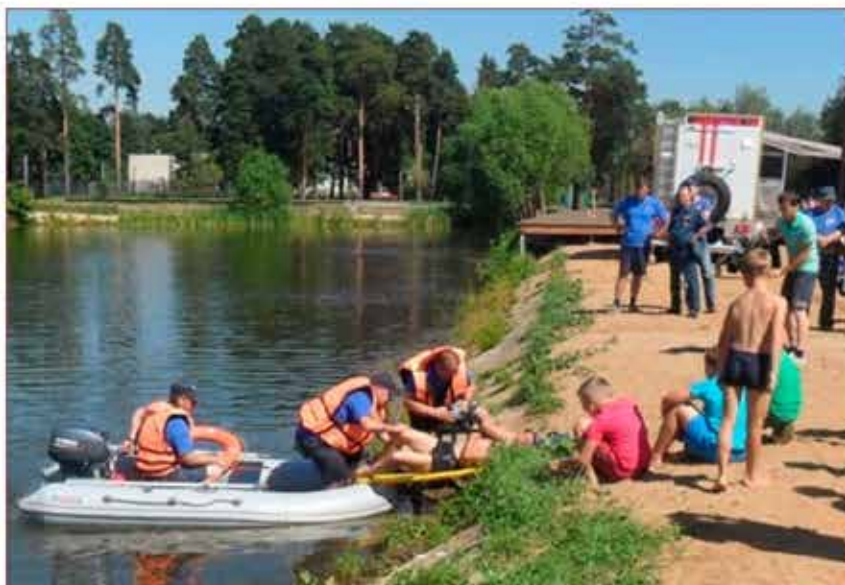
Работа спасателей ГКУ «МГПСС» важна для отдыхающих

Готовность дежурных смен к реагированию на происшествия на водных объектах и к проведению аварийно-спасательных работ – постоянная.