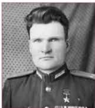
Артемий Сергеевич Яровой

(02.11.1908–21.08.1994 гг.) Герой Советского Союза, Дата указа – 08.09.1945 г. (медаль № 8957)