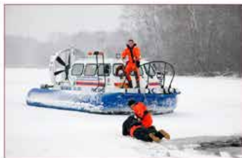
Судно на воздушной подушке «Хивус»

Московская городская поисково-спасательная служба на водных объектах считается наиболее динамично развивающейся структурой в системе обеспечения безопасности на водных объектах города Москвы.