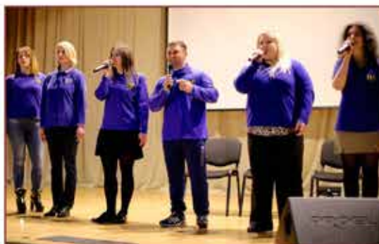
Активная творческая и спортивная жизнь сотрудников ГКУ «Система 112» залог успехов в работе