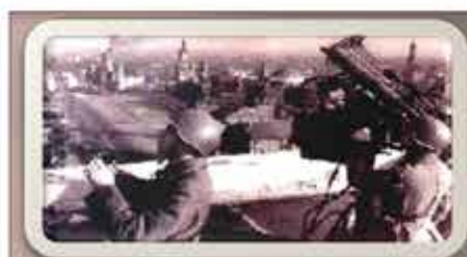
Противопожарная служба МПВО

В этом году Советское правительство издало ряд постановлений, направленных на создание и укрепление противовоздушной обороны страны. В том числе Постановление «О мерах противовоздушной обороны при постройках в 500-километровой приграничной полосе». В 30-е годы XX-го века состояние противовоздушной обороны (ПВО) Советского Союза неоднократно рассматривалось на правительственном уровне. Результатом этих обсуждений стало принятие ряда документов, определивших основы ее организации на всей территории страны.