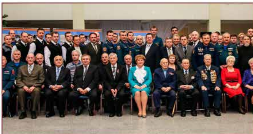
Отчетно-выборное собрание ветеранских организаций