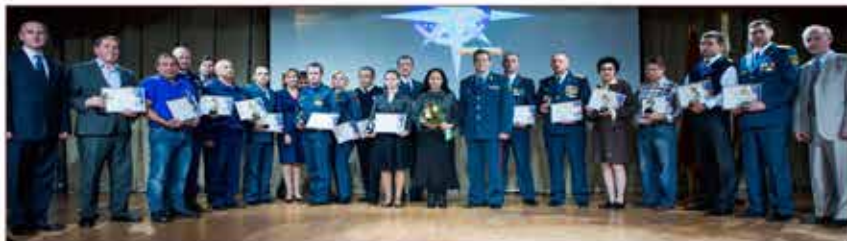
Сотрудники ПСЦ – победители фестиваля «Созвездие мужества» 2017 г.