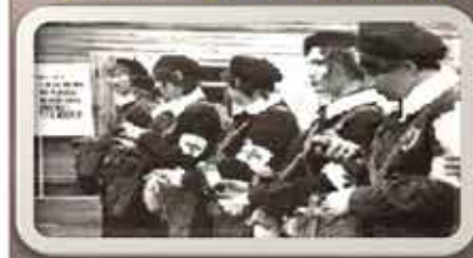
Медицинско-санитарная служба МПВО (сандружинницы)