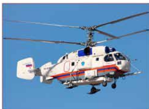
Вертолет КА 32А