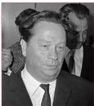
Владимир Фёдорович Промыслов