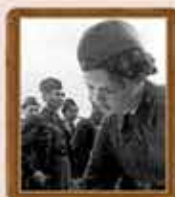
Девушки-бойцы МПВО получают оружие. 1941 год

Согласно этому постановлению все советские граждане от 16 до 60 лет должны были, овладеть необходимыми знаниями по МПВО.