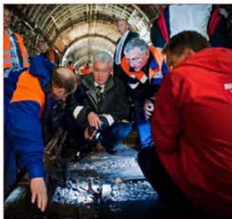
Участие С.С.Собянина в ликвидации аварии