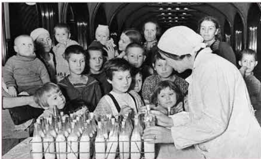
Московское метро в годы войны стало бомбоубежищем

Перед лицом реальной угрозы войны за два предвоенных года в Москве было построено и оборудовано 700 соответствующих требованиям того времени газоубежищ и 2613 бомбоубежищ. Была проделана большая работа по приспособлению под укрытия станций метрополитена. В результате на станциях и в тоннелях метро можно было укрыть до 500 тыс. человек. В Москве регулярно проводились учения и тренировки сил МПВО.