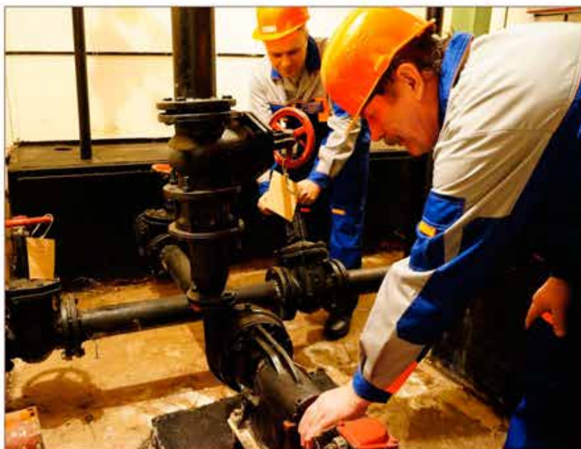
Повседневная деятельность предприятия в надежных руках

Государственное унитарное предприятие города Москвы «Специальное предприятие при Правительстве Москвы» (ГУП СППМ), является уникальной организацией в области решения задач гражданской обороны, ликвидации последствий чрезвычайных ситуаций и пожарной безопасности города Москвы.