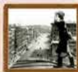
Бойцы МПВО на охране московского неба 1941 год

ствий нападения с воздуха лежала на штабе и службах МПВО г. Москвы. Главными направлениями в работе штаба МПВО столицы являлись организация следующих мероприятий: строительство бомбоубежищ и укрытий; подача сигналов об опасности воздушного нападения врага; защита людей; создание системы наблюдения и разведки; организация спасательных работ; организация аварийно-восстановительных работ, борьба с пожарами и загораниями. Таким образом, все вопросы, связанные с непосредственной защитой населения и объектов от воздушного нападения находились в поле зрения городских органов власти и штабов МПВО районов. Для решения задач противовоздушной обороны широко привлекались силы и средства организаций, учреждений, предприятий и практически все трудоспособное население города.