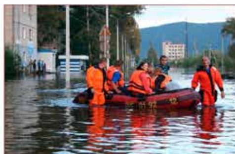
Применение сил и средств МГСЧС