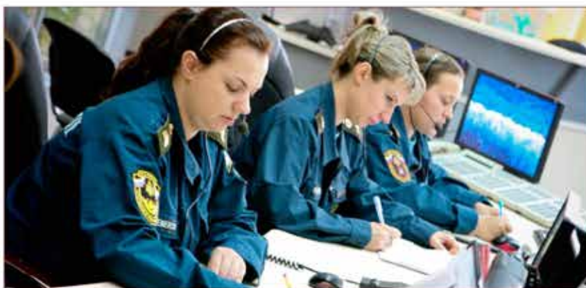
Специалисты ЦУКС обрабатывают информацию

Сегодня территориальный пожарно-спасательный гарнизон города Москвы включает в себя 142 пожарно-спасательных подразделения общей численностью более 12500 человек.