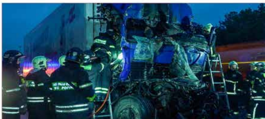
Спасатели ликвидируют последствия ДТП

Сотрудники ПСЦ привлекаются и для решения задач за пределами Москвы. Так, в связи с масштабными и продолжительными