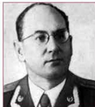
Герой Советского Союза К.М. Гонтарь