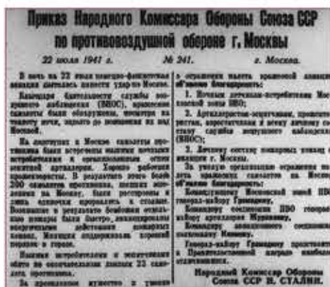
Приказ Народного Комиссара Обороны Союза ССР по противовоздушной обороне. 1941 г.

В период с 21 июля 1941 год по апрель 1942 года немецкая авиация совершила 141 налет на Москву. В воздушных атаках на город было задействовано около 8600 самолетов. К городу удалось прорваться 234 самолетам. Силами ПВО было уничтожено 1392 самолета. При налетах на столицу было сброшено 1610 фугасных бомб и более 110 тыс. зажигательных, только 16 фугасных и несколько сотен зажигательных бомб были сброшены на территорию Кремля. Во время