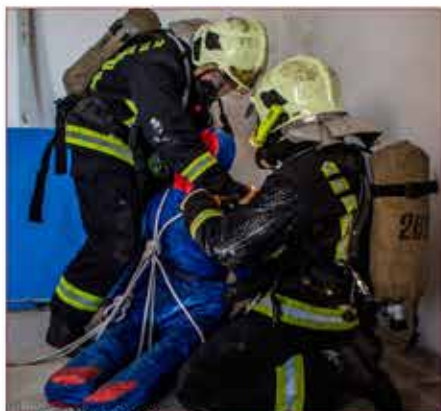
Соревнования специалистов газодымозащитной службы гарнизона

Все эти подразделения осуществляют круглосуточное дежурство и находятся в постоянной готовности к применению. Только в 2016 году подразделения Центра совершили 50 056 выездов, что составило треть всех выездов гарнизона пожарной охраны Москвы. На пожарах спасено 145 человек, 180 человек – при дорожно-транспортных происшествиях, 3417 человек – при других аварийно-спасательных работах (в том числе на социальных