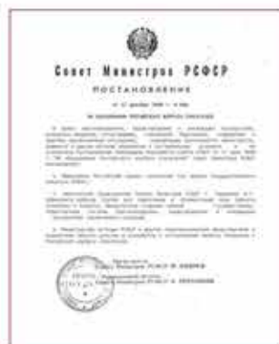
Постановление о создании Российского корпуса спасателей

19 ноября 1991 года на базе Государственного комитета РСФСР по чрезвычайным ситуациям и Штаба гражданской обороны РСФСР, был образован Государственный комитет по делам гражданской обороны, чрезвычайным ситуациям и ликвидации последствий стихийных бедствий при Президенте РСФСР. В результате впервые в РФ был создан федеральный орган исполнительной власти, специально уполномоченный на решение задач в области защиты