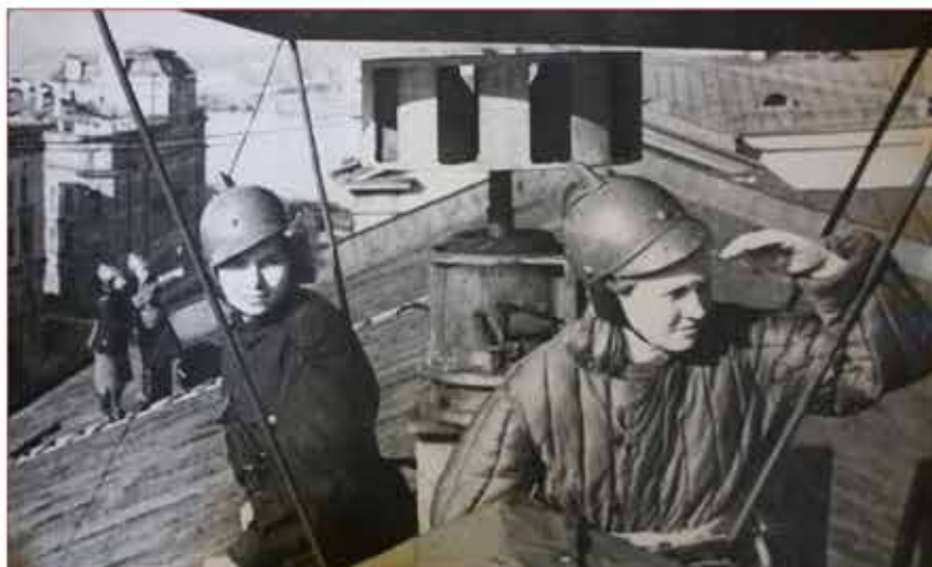
Бойцы Московского комсомольско-молодежного полка на дежурстве

9 июля 1941г. по инициативе МГК ВКП(б) и ЦК ВЛКСМ Исполком Моссовета принял решение о создании Московского комсомольско-молодежного полка численностью 5 000 чел. для усиления противопожарной обороны, в него входили юноши и девушки в возрасте 15–18 лет – рабочие, студенты, учащиеся школ и ремесленных училищ.