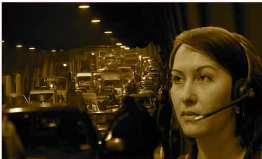
За каждый звонок в ответе

У истоков ГКУ «Система 112» стояли трудовые коллективы двух организаций – ГУП «Московский центр пожарной безопасности» (ГУП «МЦПБ») и ЗАО «Московская служба спасения» (Московская служба спасения).