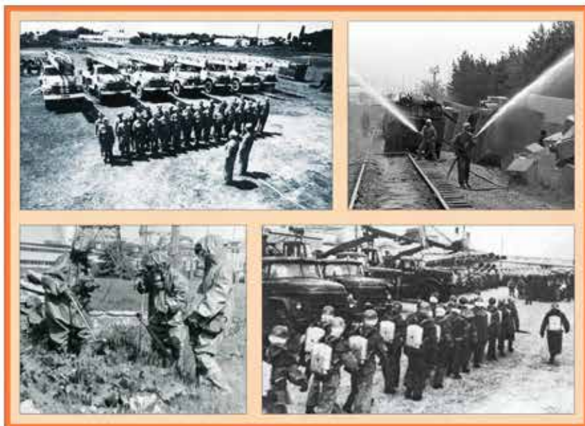
Совершенствование системы гражданской обороны страны

жение запасов горючих, взрывоопасных и сильнодействующих ядовитых веществ на объектах народного хозяйства; создание защищенных запасов продовольствия, одежды, медикаментов, медицинского имущества, предметов первой необходимости и