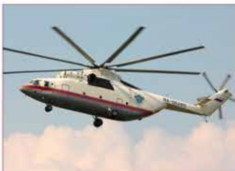
Вертолет МИ 26

захвата грузов при разборе завалов и автокатастроф (ГРАПЛ) (грузоподъемностью 5 тонн).