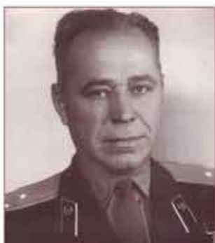
Петр Ефимович Алдуненков

(09.08.1921–15.04.1995 гг.) Герой Советского Союза, Дата указа – 21.02.1945 г. («Золотая медаль» № 8029)