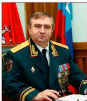
Начальник ГУ МЧС России по г. Москве А.М. Елисеев (2000–2015 гг.)

дальнейшее развитие столичного Главного управления ГОЧС и МЧС внесли генерал-полковник внутренней службы А.М. Елисеев (2000–2015 гг.), а также генерал-майор Е.М. Кистанов (1994–1997 гг.), генерал-лейтенант милиции В.М. Панкратов (1997–1999 гг.).