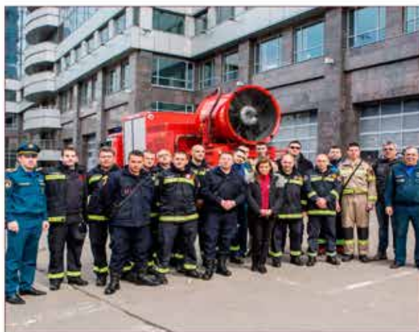
Делегация из Сербии в ПСО 207 ГКУ «ПСЦ»