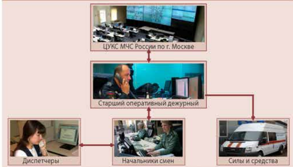
Структурная схема Единого Дежурно-Диспетчерского Центра реагирования на ЧС г. Москвы

За годы работы московская подсистема МГСЧС показала себя работоспособной и эффективной структурой. Эффективная работа Московской подсистемы позволяет снизить количество ЧС, предотвратить гибель людей на пожарах, уменьшить материальный ущерб экономики города, частных лиц. Все это становится возможным благодаря совместным усилиям в работе руководителя ГО Москвы С.С. Собянина, членов Правительства Москвы, Московской городской Думы, руководства и сотрудников Главного управления МЧС России по г. Москве, Департамента по делам гражданской обо-