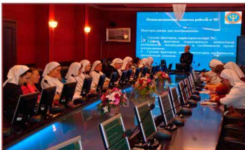
Занятия с сестрами милосердия по программам ГО

В административных округах г. Москвы задачи по подготовке населения в области ГО и ЧС решают учебно-методические центры по ГО и ЧС (УМЦ АО), которые являются структурными подразделениями ГКУ ДПО «УМЦ ГО и ЧС» и предназначены для организации курсового обучения руководителей и специалистов ГО и МГСЧС, а также обучения работающего и неработающего населения.