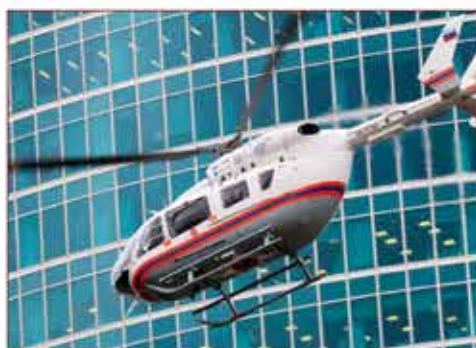
Вертолет ВК 117С-2