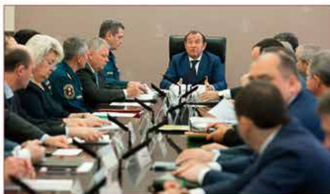
Заседание Комиссии по чрезвычайным ситуациям и пожарной безопасности г. Москвы