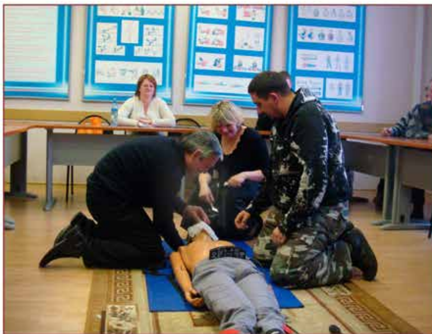
Практические занятия по оказанию доврачебной помощи