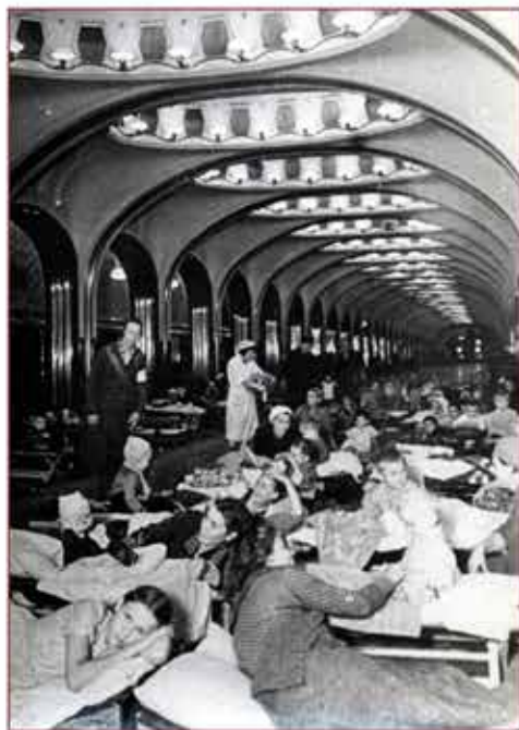
Убежище на станции метро «Маяковская», 1941 г.

Большой вклад в общее дело внесли службы убежищ, светомаскировки и другие. Например, звенья убежищ оказывали помощь населению в момент подачи сигнала «Воздушная тревога», они занимали свои посты в убежищах и организованно распределяли людей по отсекам, следили за порядком в убежищах, принимали меры к оказанию помощи заболевшим. Бойцы этих звеньев всегда