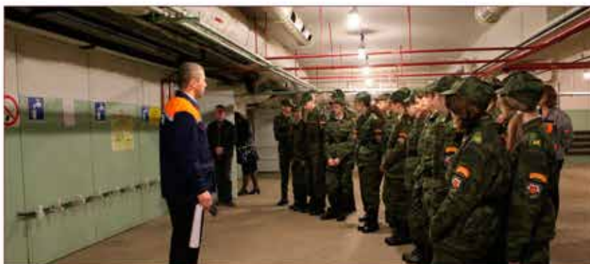
Экскурсия в защитное сооружение