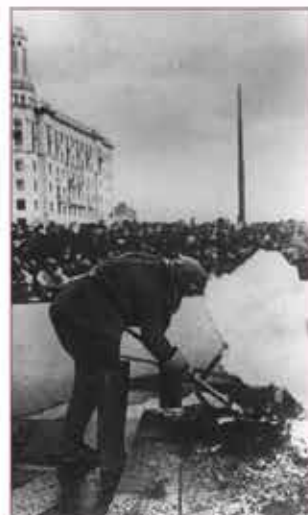
21 июля 1941 года. Площадь Пушкина. Показ уничтожения вражеских зажигалок

В первом налёте на Москву в ночь с 21 на 22 июля 1941г. участвовало 220 немецких самолетов, которые сбросили 104 фугасных бомб и более 46 тысяч штук «зажигалок». По некоторым оценкам, только половина вылетевших вражеских экипажей смогла выполнить задание. В результате первого налета пострадало 792 челове-