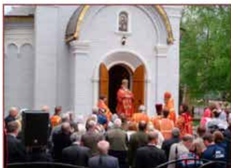
Служба в часовне св. Георгия Победоносца – всегда событие

В 2015 году Учебно-методический центр распоряжением Правительства Москвы от 14.07.2015 № 393-РП получил статус государственного казенного учреждения