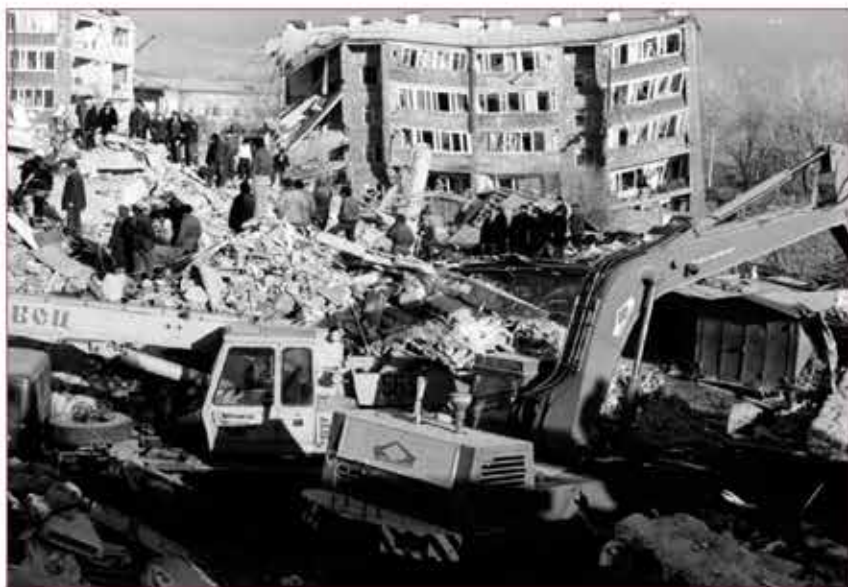
Последствия Спитакского землетрясения в Армении, 1988 г.

На данном этапе уже значительная часть сил содержалась в состоянии реальной постоянной готовности к действиям в ЧС мирного времени.