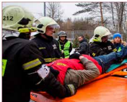
Соревнования спасателей гарнизона по ликвидации ДТП

выездах). Пострадавшим на происшествиях 1 313 раз оказывалась первая доврачебная помощь, 388 раз – медицинская помощь.