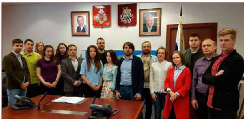
Совет молодых специалистов Департамента ГОЧСиПБ

девушек. Одной из задач Совета является воспитание молодых специалистов в духе патриотизма, уважения к Отечеству, к городу Москве.