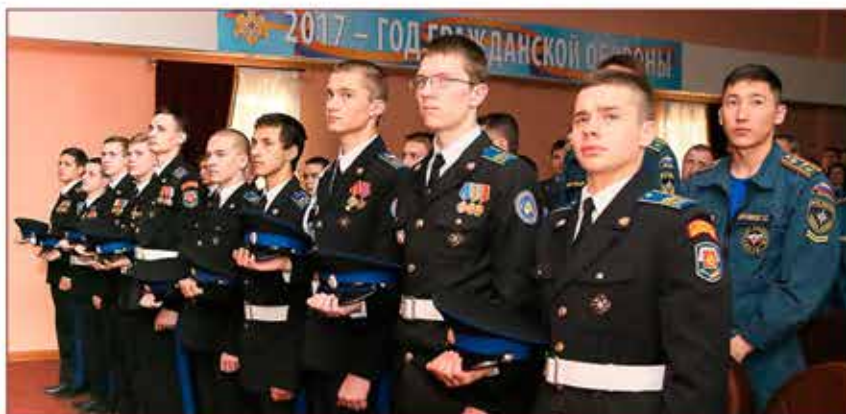
Кадеты и студенты Технического пожарно-спасательного колледжа № 57 имени Героя Российской Федерации В.М. Максимчука на конференции

ны «Безопасности жизнедеятельности», проведения совместных мероприятий и обучения населения, специалистов в области пожарной безопасности и спасательного дела для столицы. ГБОУ СПО города Москвы Технический пожарно-спасательный колледж № 57 имени Героя Российской Федерации В.М. Максимчука уже много лет готовит специалистов этих профессий для пожарно-спасательных подразделений города.