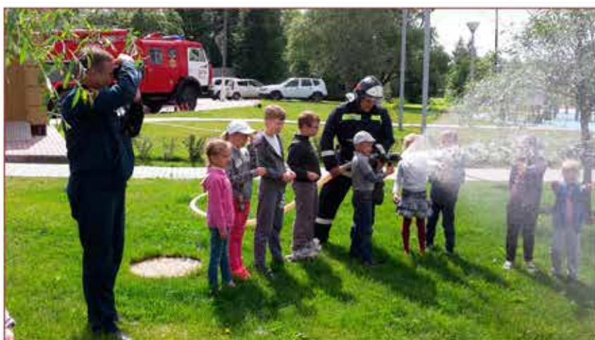
Добровольцы обучают основам безопасности жизнедеятельности детей

Содействие развитию физической культуры и поддержка пожарно-прикладного спорта среди детей и молодежи является одной из основных социально-значимых задач деятельности РОУ «ДПК «Сигнал-01».