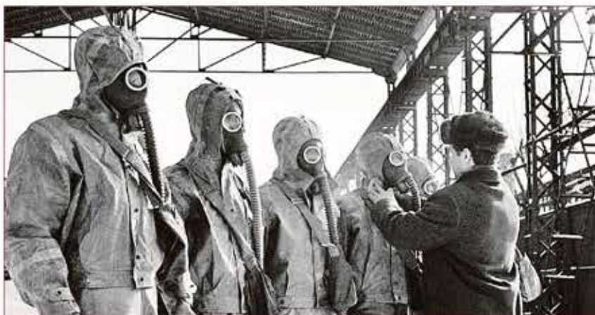
Подготовка специалистов гражданской обороны предприятий

приятий в городах и на объектах, которые могут подвергнуться ударам противника.