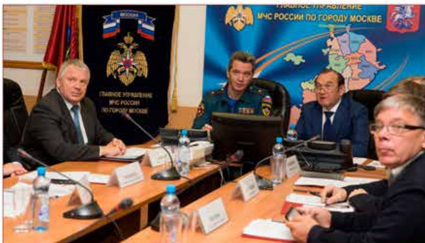
Подведение итогов деятельности МГСЧС под руководством П.П.Бирюкова

Одной из основных задач МГСЧС является своевременное и достоверное информирование населения о состоянии безопасности и принимаемых мерах при угрозе или возникновении ЧС. С этой целью в столице создана и функционирует Единая система оперативно-диспетчерского управления в чрезвычайных ситуациях города Москвы (ЕСОДУ Москвы).