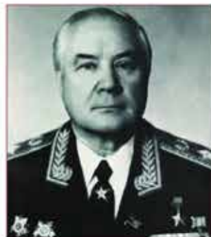
Начальник Гражданской обороны СССР генерал армии В.Л. Говоров

Так, одним из важнейших решений того времени было требование иметь в штабах ГО два оперативных плана гражданской обороны: план ГО на военное время; отдельный план ГО мирного времени на случай возможных ЧС, связанных с возникновением стихийных бедствий, крупных аварий и катастроф.