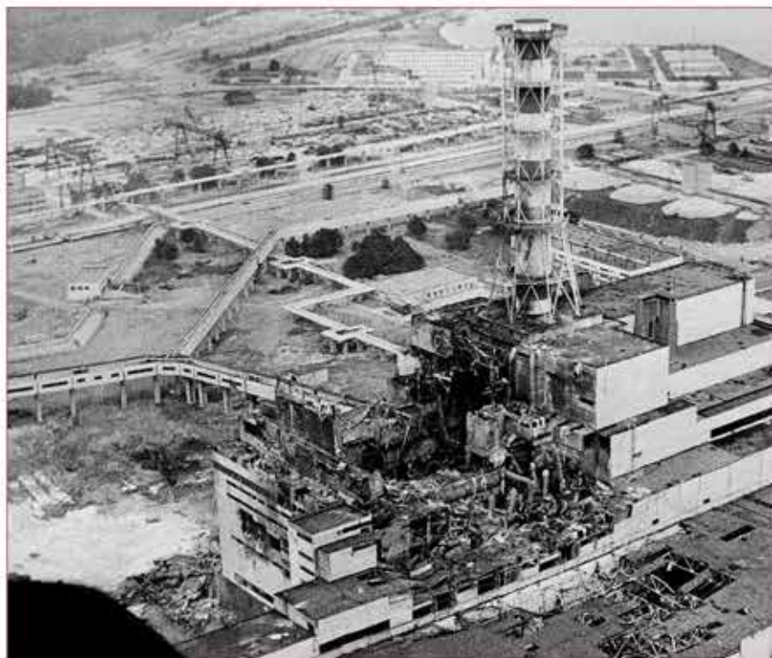
Авария на Чернобыльской АЭС, 1986 г.

Основа для этого была. Гражданская оборона не гарантировала, да и не могла гарантировать абсолютную защиту населения от современных средств поражения и в то же время стояла в какой-то степени в стороне от потребностей жизни мирного времени. Не были своевременно учтены изменения, происходящие в структуре отраслей народного хозяйства, которые требовали расширения задач, решаемых гражданской обороной в мирное время.