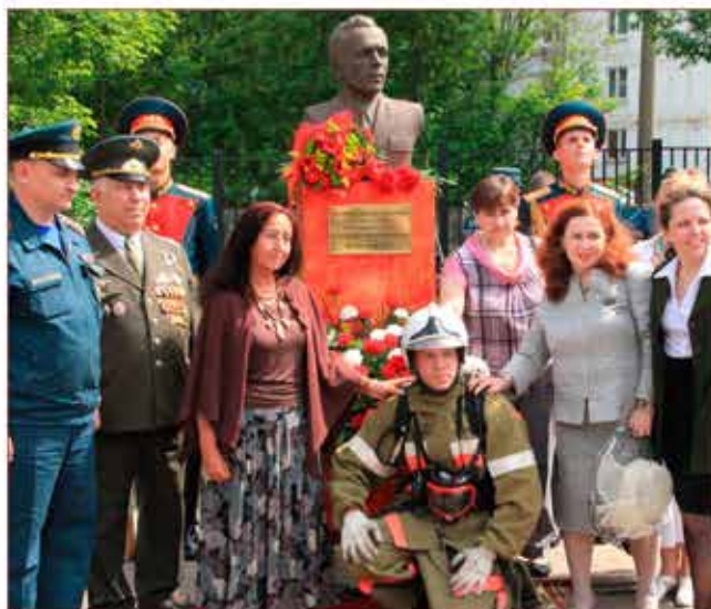
Открытие памятника В.М. Максимчуку

В современных условиях работа по героико-патриотическому воспитанию с молодежными движениями занимает все более значимое место. На это указывает внимание и участие в ней Правительства РФ и г. Москвы, должностных лиц ГУ МЧС России по г. Москве и Департамента ГОЧСиПБ.