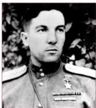
Сергей Игнатьевич Постевой

(07.10.1921–26.05.2000 гг.), Герой Советского Союза, Дата указа – 13.09.1944 г. (медаль № 3497)