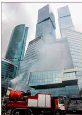
Учения подразделений ГКУ «ПСЦ» в Москва-Сити

В составе Центра также имеются: отряд специальной пожарной техники, где на вооружении специальная техника для ликвидации крупных ЧС в Москве и других регионах; отряд по тушению пожаров на водных объектах на базе многоцелевого пожарно-спасательного корабля «Полковник Чернышев»; отряд инже-