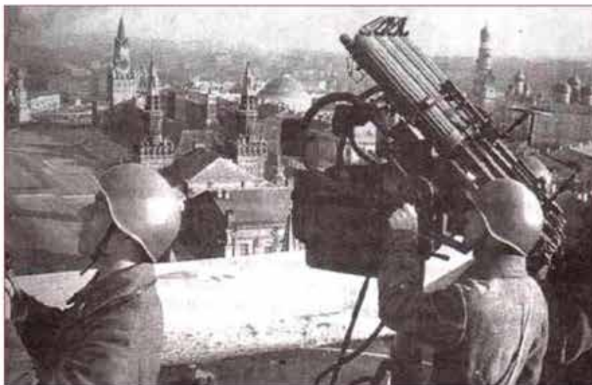
Бойцы МПВО-защитники Москвы, 1941 г.

оповещения, охраны общественного порядка и безопасности, светомаскировки, противохимической защиты и др. Основными