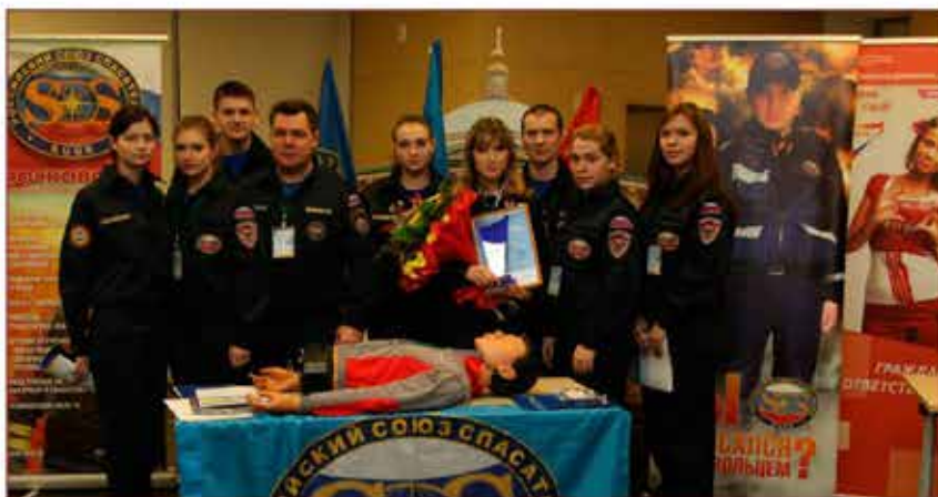
Юные пожарные столицы – победители конкурса

За прошедший год добровольцы-спасатели около 1 000 раз участвовали в Аварийно-спасательных работ на городских объектах, в т.ч. 120 раз – на пожарах. Ими спасено 28 человек; 97 выездов сделано добровольцами на дорожно-транспортные происшествия на улицах Москвы, где 27 человек получили от них первую медицинскую помощь и направлены в медицинские учреждения, спасено девять человек. Ведется кропотливая работа по обучению всех слоев населения правилам безопасности жизнедеятельности.