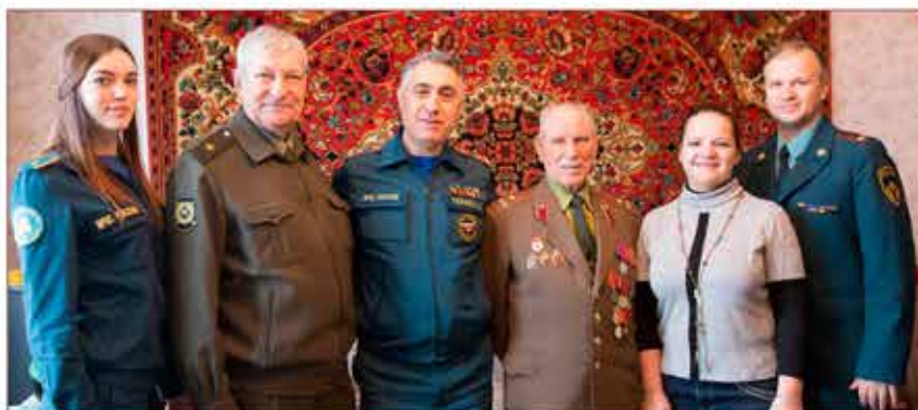
Участие ветеранов и молодежи в акции «Помоги ветерану»

Особое внимание в деятельности общественных организаций уделяется связи поколений, формированию у молодежи любви к Отечеству и гордости за боевые и трудовые подвиги наших предшественников. Важным является передача и закрепление лучших традиций, сложившихся и накопленных в подразделениях по использованию высоконравственного и жизненного опыта ветеранов войны и труда, пропаганда культуры России, а также поддержание у ветеранов, находящихся на заслуженном отдыхе, чувства сопричастности к жизни подразделений, сопереживания успехам их бывших коллективов.