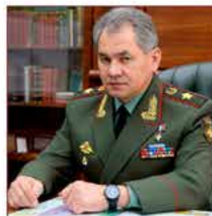
Министр обороны РФ, генерал армии С.К. Шойгу