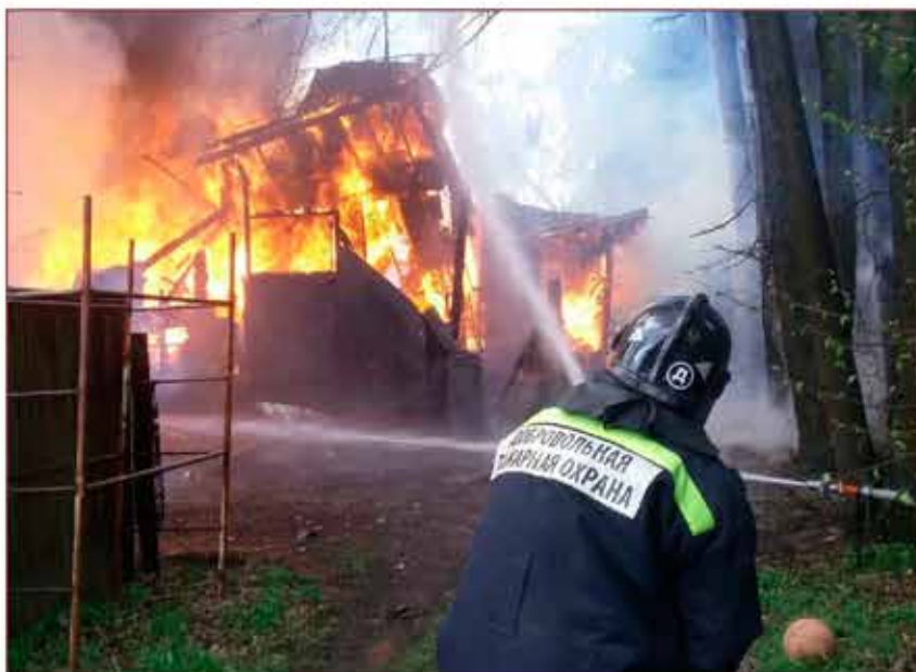
Пожарные добровольцы на тушении пожара в г. Москве