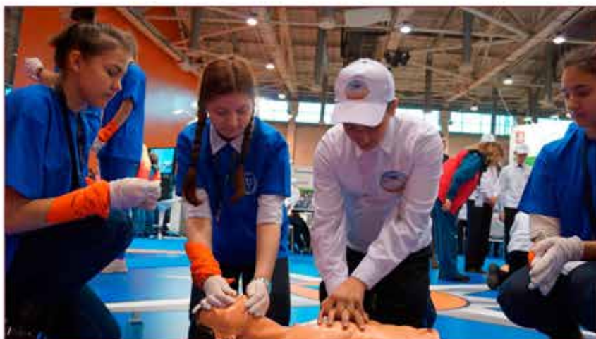
Практические занятия по оказанию первой доврачебной помощи

Студенты-спасатели Московского городского отделения ВМО «ВСКС» совместно с аварийно-спасательными формированиями города участвовали в сотнях спасательных операциях, были надежным вторым эшелоном при ликвидации ЧС различного масштаба, оказывали содействие органам управления МГСЧС в обучении юных москвичей практическим навыкам и умениям правильно действовать при возникновении чрезвычайных ситуаций, ежегодно они готовят и проводят такие значимые мероприятия, как «Школа безопасности» и «Юный спасатель».