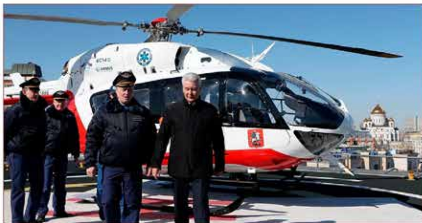
Мэр Москвы С.С. Собянин встречается с сотрудниками ГКУ «МАЦ»

Порядок применения воздушных судов ГКУ «Московский авиационный центр» определен приложением № 25 к «Расписанию выезда подразделений гарнизона пожарной охраны города Москвы для тушения пожаров и проведения аварийно-спасательных работ» согласованному с Главным управлением МЧС России по г. Москве и утвержденному Мэром Москвы С.С. Собяниным.