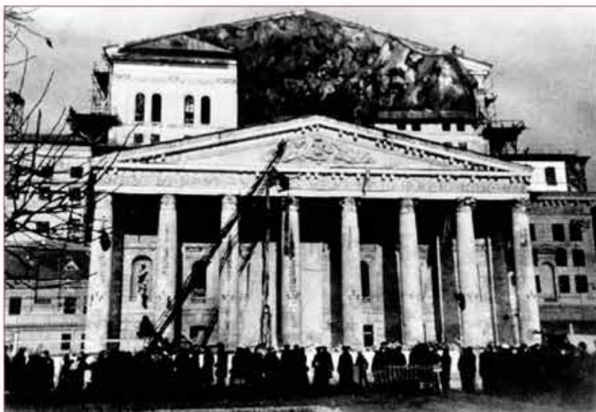
Маскировка Большого театра силами бойцов МПВО, 1941 год.

ными для этого инструментами, поэтому стояла задача научить пиротехника обезвреживать бомбы.