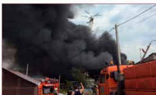
Тушение пожара в п. Шишкин лес. Вертолет КА-32А участвует в ликвидации ЧС