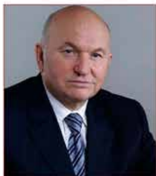
Ю.М. Лужков, Мэр Москвы (1992–2010 гг.)

Московская городская территориальная подсистема единой государственной системы предупреждения и ликвидации чрезвычайных ситуаций (МГСЧС) начала создаваться в 1995 г., что стало важной вехой в истории развития и становления чрезвычайной службы Москвы. МГСЧС является одним из элементов общероссийской системы обеспечения безопасности.