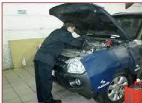
Трудовые будни предприятия по ремонту техники