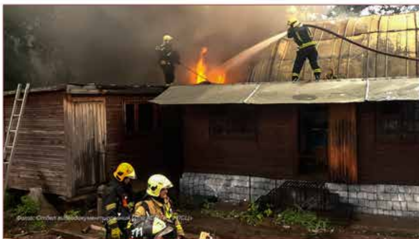
Работа пожарно-спасательных подразделений на пожаре

В рамках разграничений полномочий федеральных и региональных органов власти было подписано соглашение между МЧС России и Правительством Москвы о передаче друг другу части своих полномочий в решении вопросов тушения пожаров и предупре-