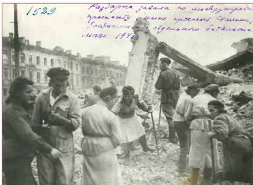
Разборка завала по Международному проспекту бойцами отдельного батальона МПВО. 1943 г.

Служба связи и оповещения базировалась на существующих городских сетях и узлах телефонной связи столицы, а также на специальных средствах связи КП Московской зоны ПВО. Для оповещения населения об опасности нападения с воздуха использовались городские радиотрансляционные сети и электрические сирены, установленные на крышах домов.