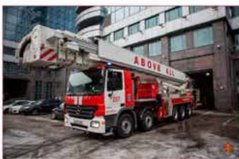
На страже безопасности столицы